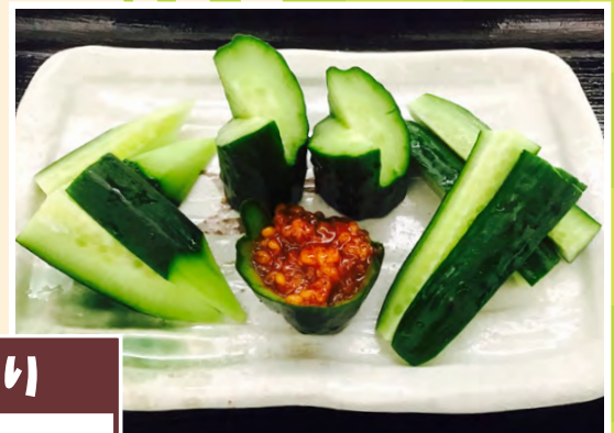
もろ味噌きゅうり