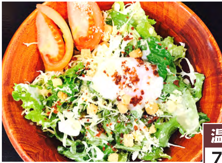
温玉シーガーサラダ