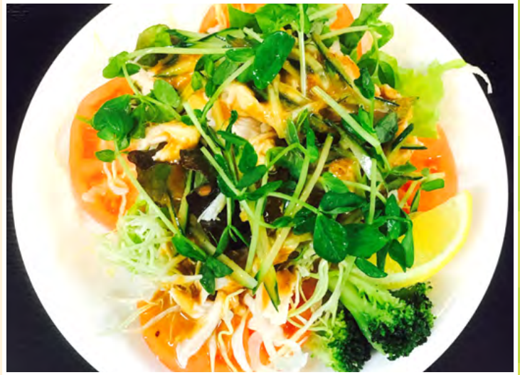
バンバンジーサラダ